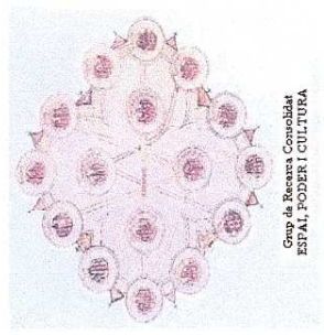
Grup de Recerca Consolidat ESPAL, PODER I CULTURA

Calia doncs, celebrar una trobada on alguns dels protagonistes de la recerca puntera posin en comú les seves aportacions i alhora, en facin divulgació en un marc formatiu com l'universitari.